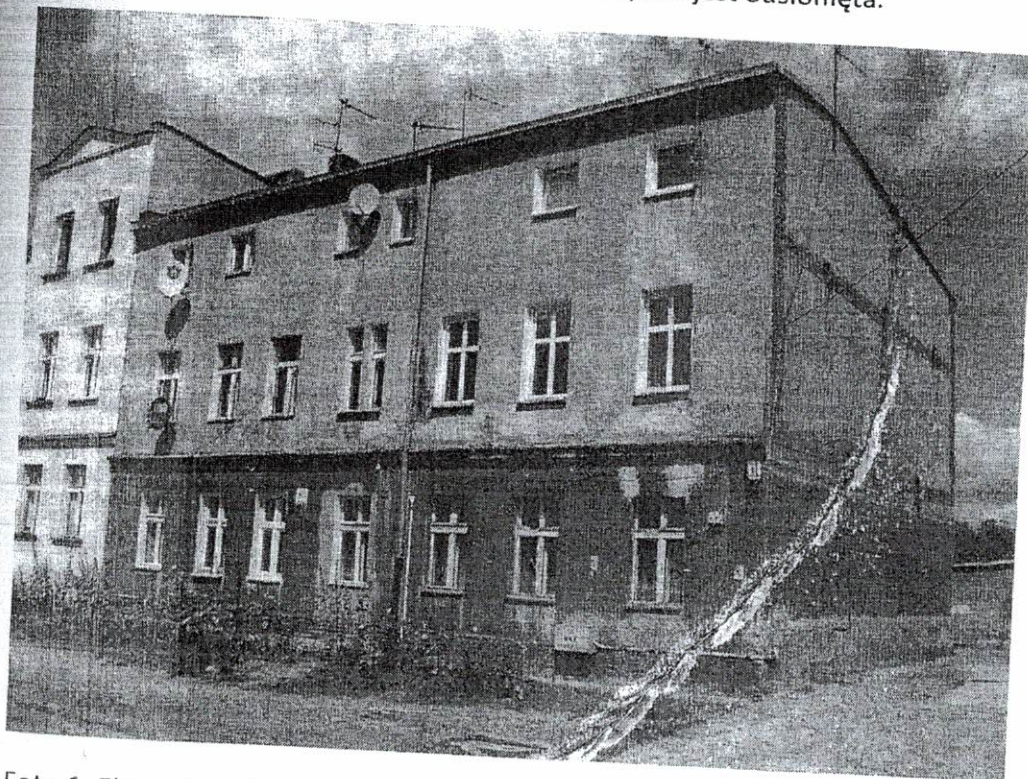
Foto 1. Elewacja południowa i wschodnia.

Opisywany budynek to trójkondygnacyjna, podpiwniczona kamienica na planie prostokąta z dachem o konstrukcji drewnianej pokrytym papą bez stropodachu. Od strony zachodniej łączy się z sąsiednim budynkiem Kazimierza Pułaskiego 21 tworząc zwartą zabudowę północnej strony ulicy . Wschodnia strona budynku jest odsłonięta.