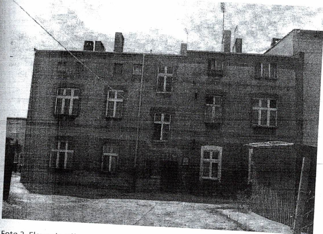
Foto 2. Elewacja północna.

Na elewacjach budynku nie stwierdzam spękań lub ubytków mogących stanowić potencjalne miejsca lęgowe ptaków lub nietoperzy. Elewacje pokrywają jedynie liczne instalacje telefoniczne, elektryczne, antenowe i gazowa. Brak miejsc potencjalnie niebezpiecznych dla ptaków. Na elewacjach budynku ani w jego sąsiedztwie nie odkryłem pozostałości gniazd lub odchodów mogących świadczyć o choćby czasowym przebywaniu ptaków w budynku.