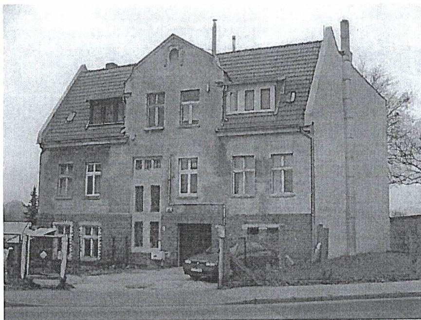
Elewacja południowa i wschodnia.

Opisywany budynek to trójkondygnacyjna budowla na planie zbliżonym do prostokąta, niepodpiwniczona. Dach o konstrukcji drewnianej od frontu spadzisty, kryty dachówka ceramiczną, od podwórza kryty papą o niewielkim spadki. Elewacje z cegły nietynkowanej. Na elewacjach budynku znajdują się nieliczne spękania i ubytki nie mogące stanowić jednak potencjalnych miejsc lęgowych ptaków lub nietoperzy. Elewacje pokrywają instalacje antenowe, elektryczna i gazowa. Brak miejsc niebezpiecznych dla ptaków. Wszystkie okna w budynku są zamknięte.