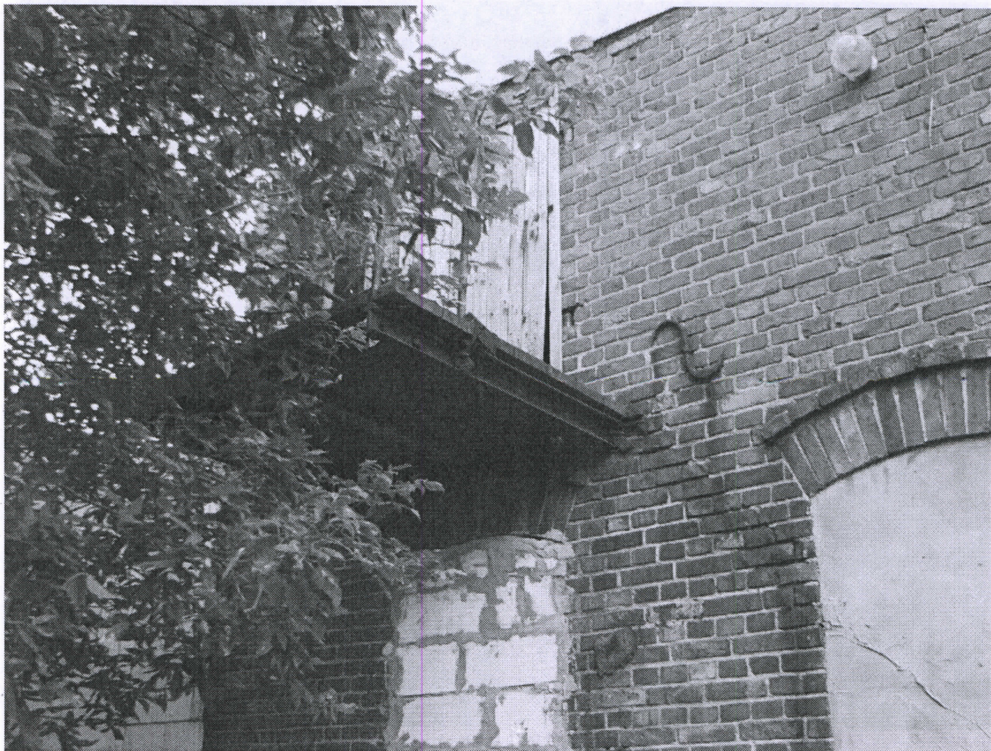
Foto.3 Budynek oficyny - widok na ścianę szczytową