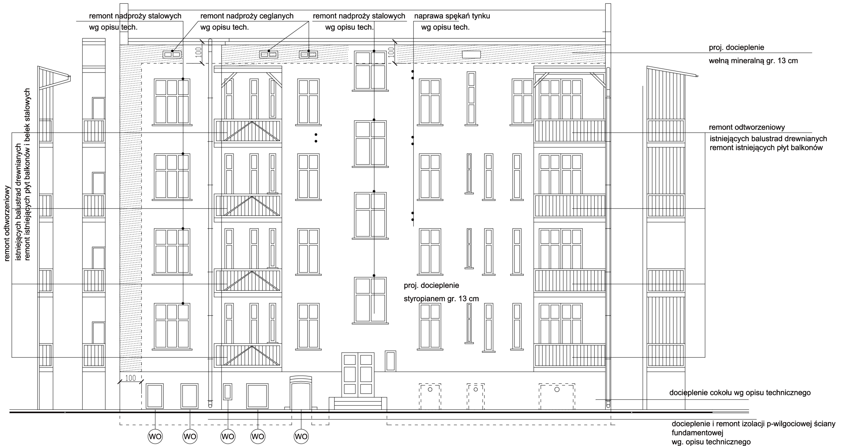
ELEVACJA PODWÓRZOWA PD-ZACHODNIA 1:100