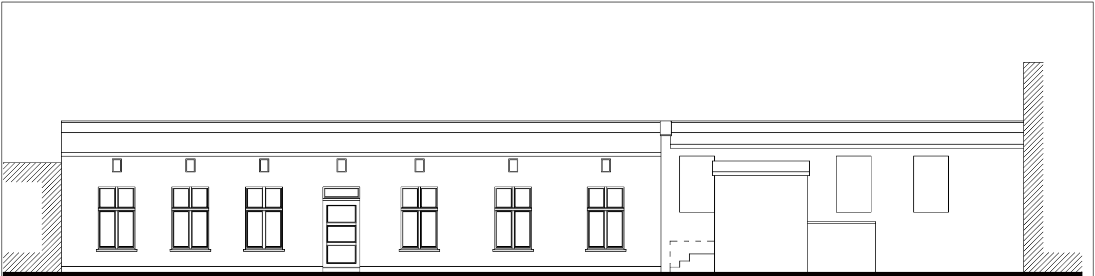
ELEWACJA POŁUDNIOWO- WSCHODNIA 1:100