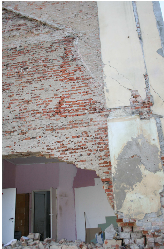
Rys.2 – j.w.

Projekt budowlany zabezpieczenia awariowanej ściany wraz z projektem jej rozbiórki dla budynku mieszkalnego wielorodzinnego zlokalizowanego przy ul. Grodzkiej 4 w Bydgoszczy.