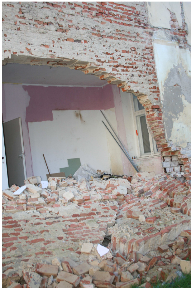
Rys.5 - j.w.