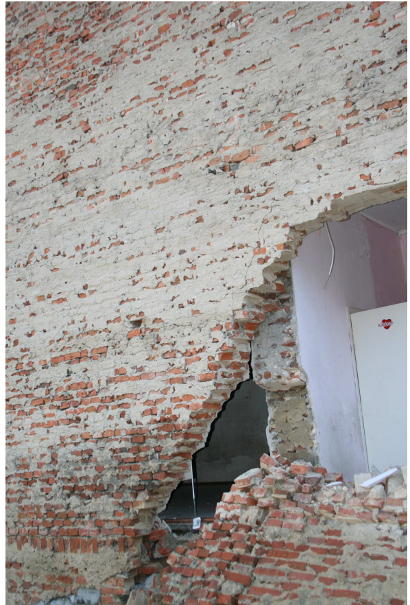
Rys.8 - j.w.

Projekt budowlany zabezpieczenia awariowanej ściany wraz z projektem jej rozbiórki dla budynku mieszkalnego wielorodzinnego zlokalizowanego przy ul. Grodzkiej 4 w Bydgoszczy.