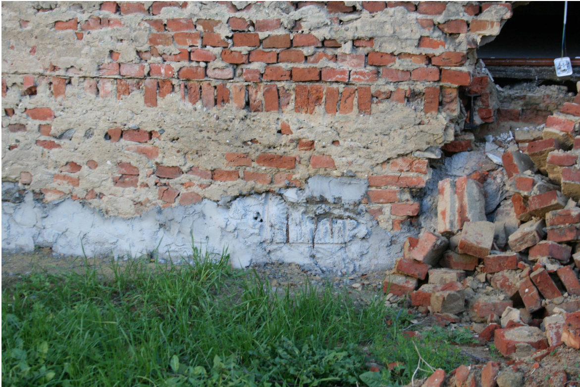
Rys.12 – Początek sklepienia – widok z lewej strony.

Projekt budowlany zabezpieczenia awariowanej ściany wraz z projektem jej rozbiórki dla budynku mieszkalnego wielorodzinnego zlokalizowanego przy ul. Grodzkiej 4 w Bydgoszczy.