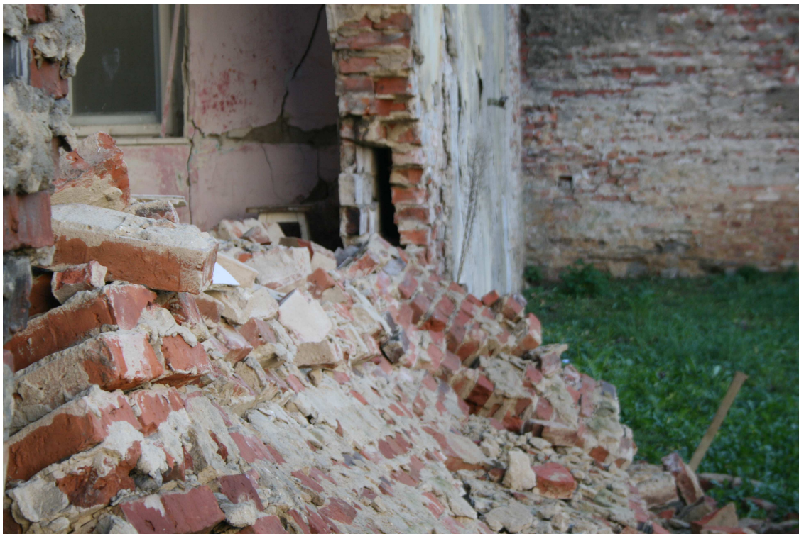
Rys.15 – Pustka w ścianie o rozwarości – 20cm (38-6-12).