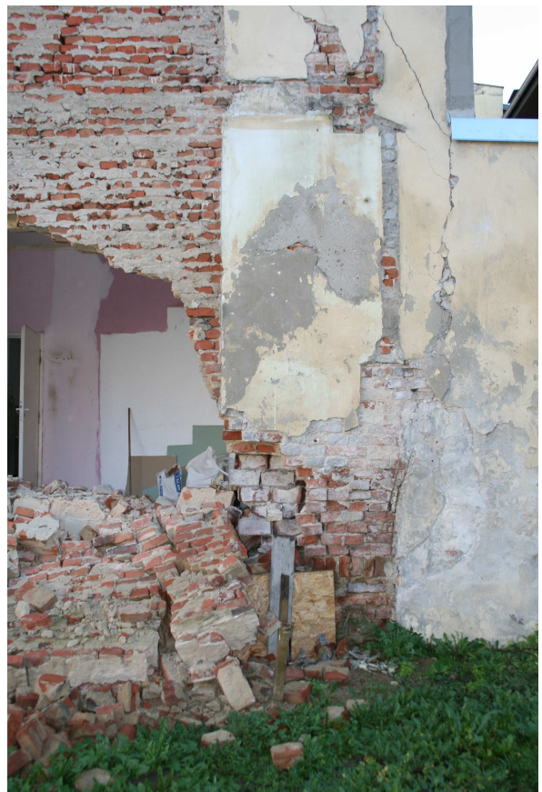
Rys.3 – Spękana prawa część wytworzona w wyniku awarii luku.