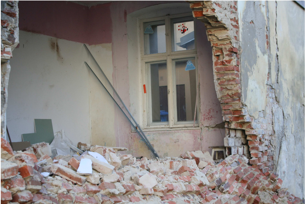
Rys. 14 – Widok sklepienia z prawej strony wraz z osłabieniem przekroju ściany pustką.

Projekt budowlany zabezpieczenia awariowanej ściany wraz z projektem jej rozbiórki dla budynku mieszkalnego wielorodzinnego zlokalizowanego przy ul. Grodzkiej 4 w Bydgoszczy.