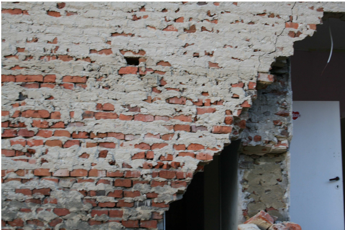
Rys.11 - Powstałe sklepienie – widok z lewej strony z widoczną odspojoną ścianą działową nośną.