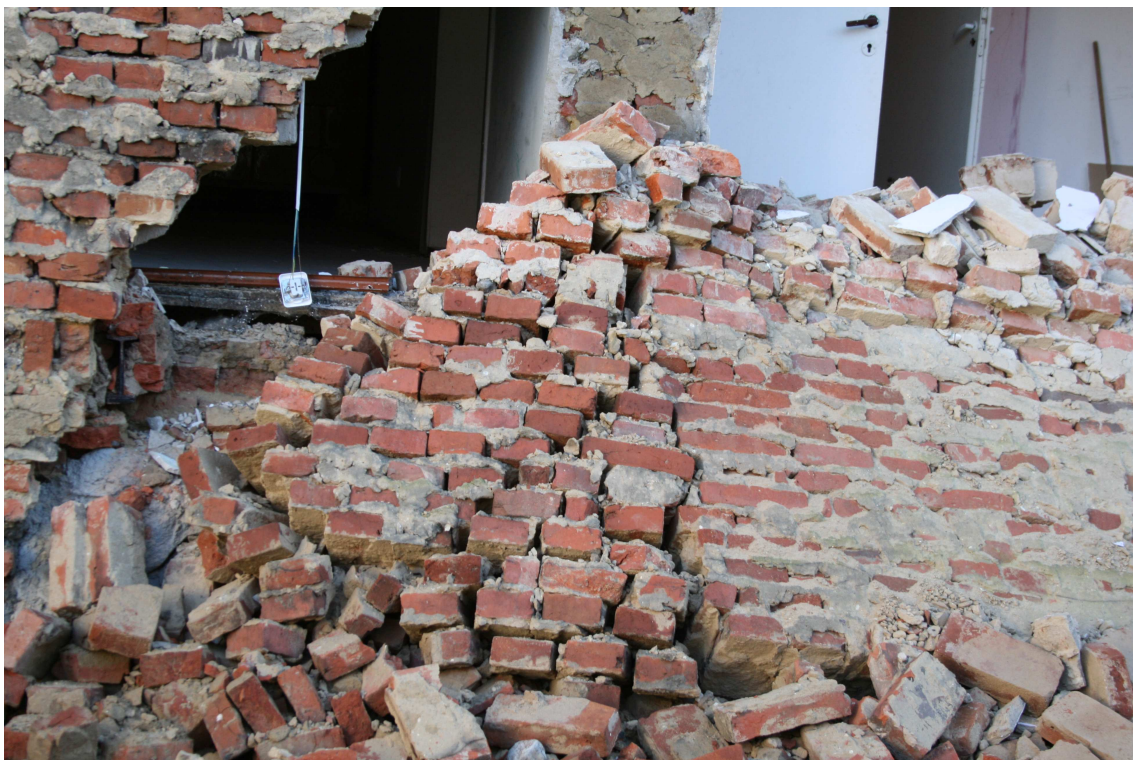
Rys.13 – Widok sklepienia z lewej strony wraz z odspojoną ścianą działową nośną.