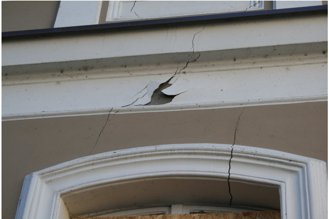
Rys.18 – Pęknięte nadproże w ścianie przy ul. Grodzkiej.

Projekt budowlany zabezpieczenia awariowanej ściany wraz z projektem jej rozbiórki dla budynku mieszkalnego wielorodzinnego zlokalizowanego przy ul. Grodzkiej 4 w Bydgoszczy.