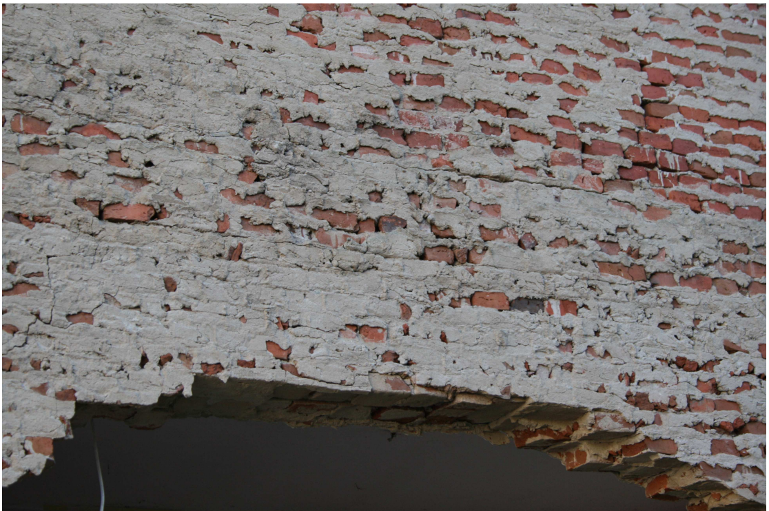
Rys.9 – „klucz” powstałego sklepienia.