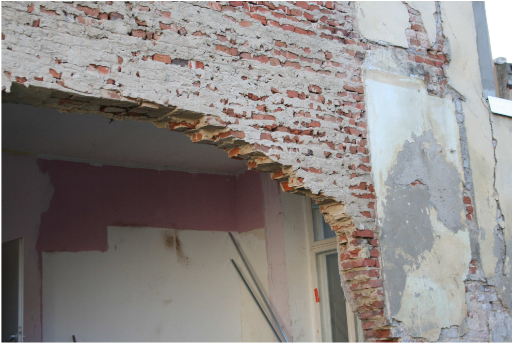
Rys.10 - Powstałe sklepienie – widok z prawej strony.

Projekt budowlany zabezpieczenia awariowanej ściany wraz z projektem jej rozbiórki dla budynku mieszkalnego wielorodzinnego zlokalizowanego przy ul. Grodzkiej 4 w Bydgoszczy.