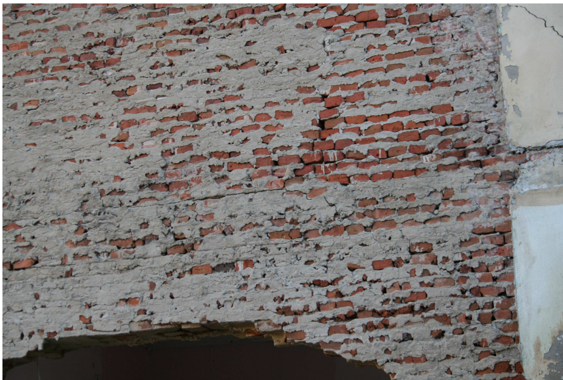
Rys.17 – Powstały łuk i spękana nad nim ściana.