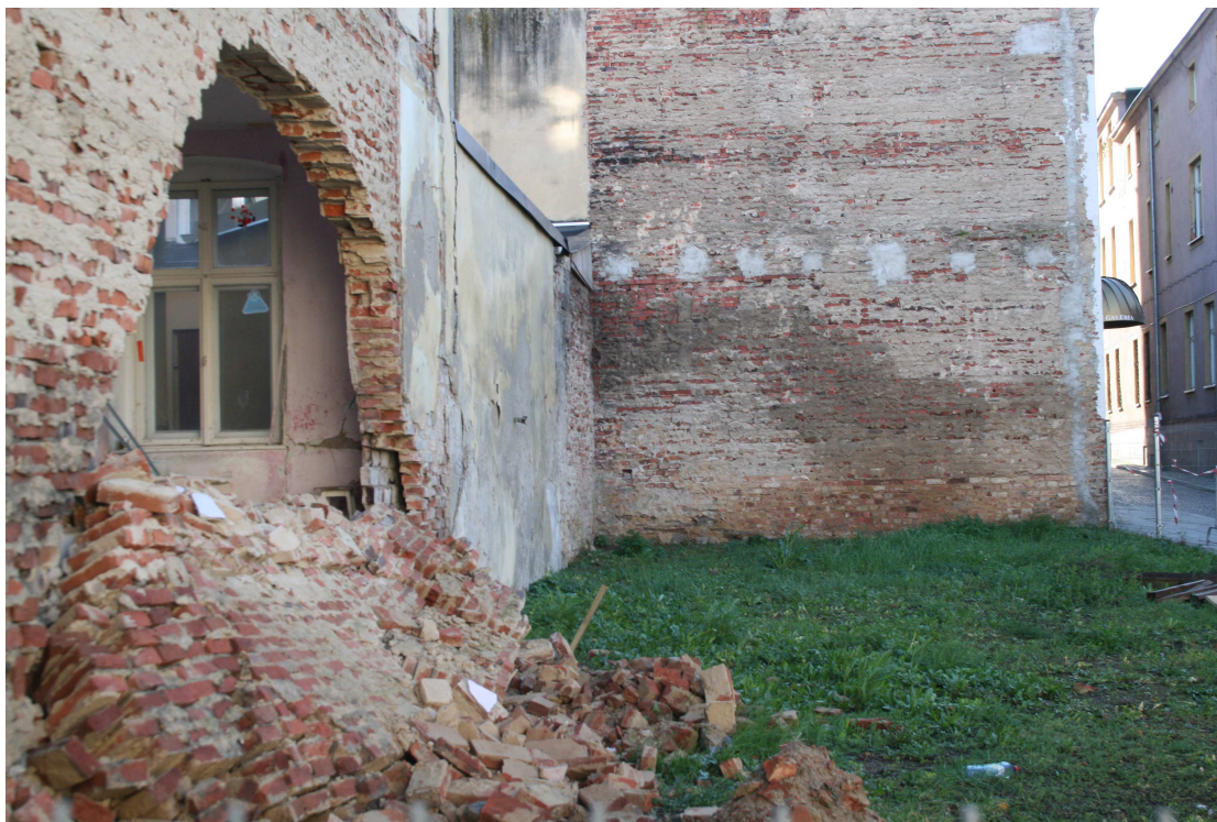
Rys.1 – Widok awariowanej ściany szczytowej podlegającej n.n. opracowaniu.

Przed przekazaniem niniejszego opracowania Zamawiającemu dokonano wizji lokalnej mającej na celu określenia stanu awariowanej ściany: