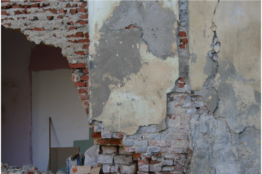
Rys.4 – j.w. zbliżenie

Projekt budowlany zabezpieczenia awariowanej ściany wraz z projektem jej rozbiórki dla budynku mieszkalnego wielorodzinnego zlokalizowanego przy ul. Grodzkiej 4 w Bydgoszczy.