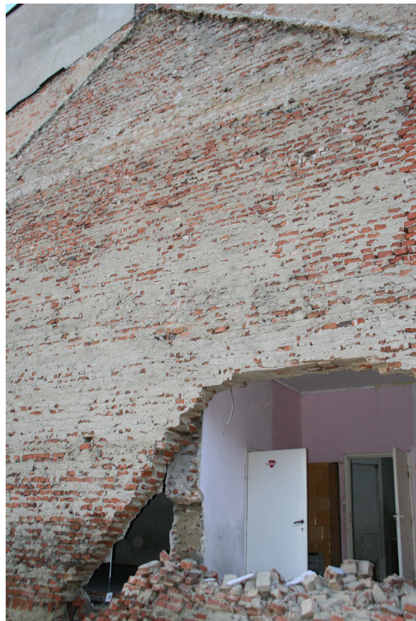
Rys.6,7 - Lewa część wytworzonego w wyniku awarii łuku wraz z widoczną odspojoną ścianą działową nośną.

Projekt budowlany zabezpieczenia awariowanej ściany wraz z projektem jej rozbiórki dla budynku mieszkalnego wielorodzinnego zlokalizowanego przy ul. Grodzkiej 4 w Bydgoszczy.