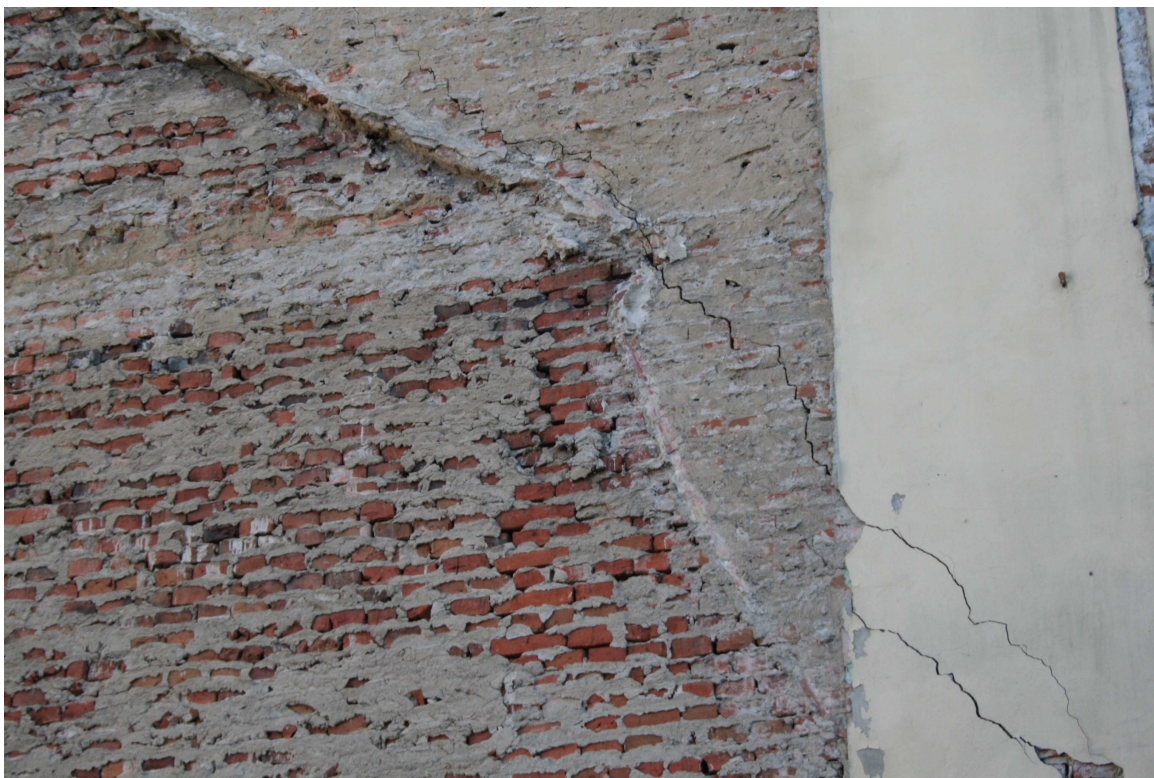
Rys.16 – Ściana szczytowa – spękana.

Projekt budowlany zabezpieczenia awariowanej ściany wraz z projektem jej rozbiórki dla budynku mieszkalnego wielorodzinnego zlokalizowanego przy ul. Grodzkiej 4 w Bydgoszczy.