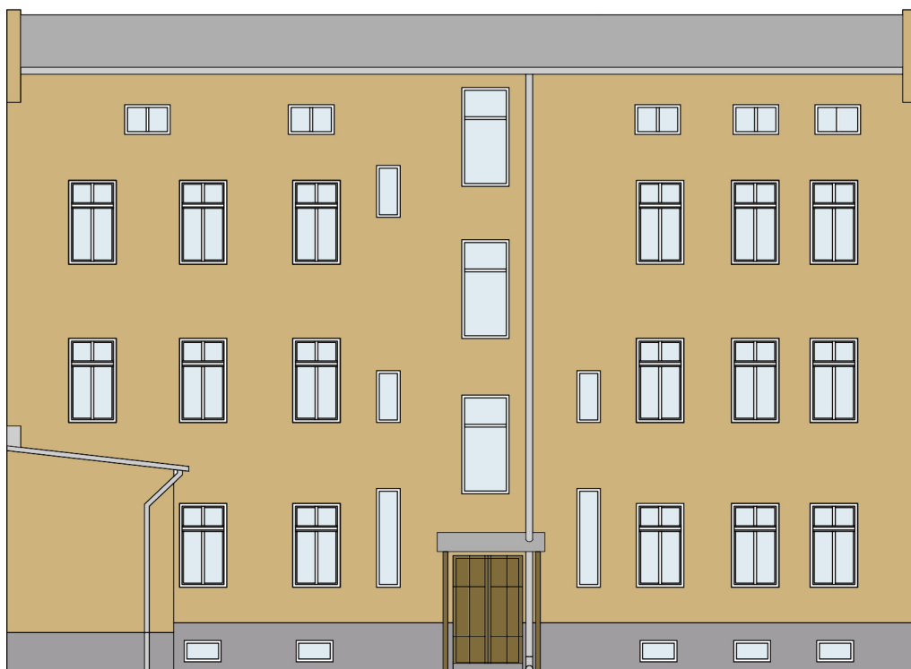
ELEWACJA PODWÓRZOWA POŁUDNIOWO -WSCHODNIA