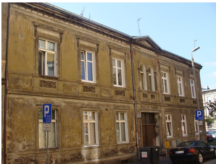
Elewacja północna (frontowa).

Opisywany budynek to trójkondygnacyjna, podpiwniczona kamienica z użytkowym poddaszem z niewielką oficyną. Bryła budynku na planie litery „L”. Dach o konstrukcji drewnianej kryty papą. Budynek usytuowany jest w południowej pierzei ulicy Lipowej. Od wschodu przylega do budynku Lipowa 9. Oficynę od południa i zachodu obrasta bluszcz. Elewacje pokrywają instalacje antenowe, gazowa, elektryczna, oświetleniowa i wentylacyjna.