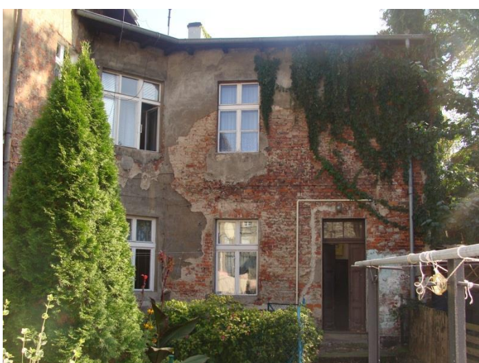
Elewacja zachodnia oficyny.