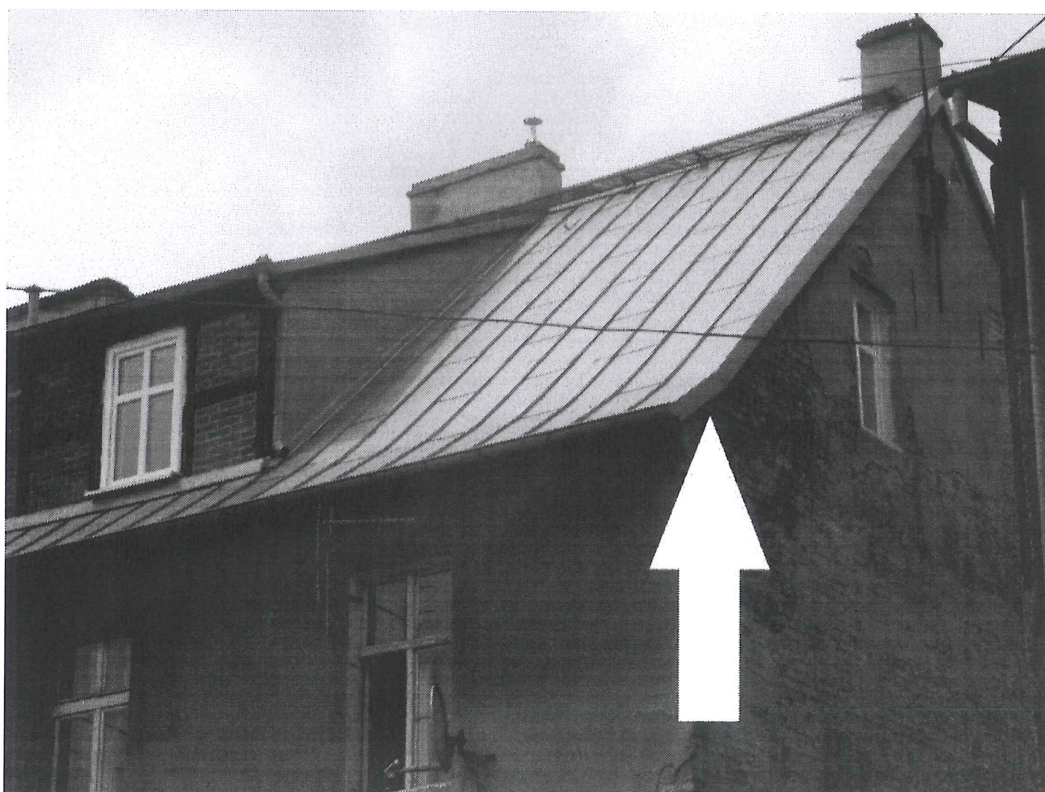
Foto: lokalizacja gniazda wróbla w budynku i jednocześnie miejsce montażu budki lęgowej.