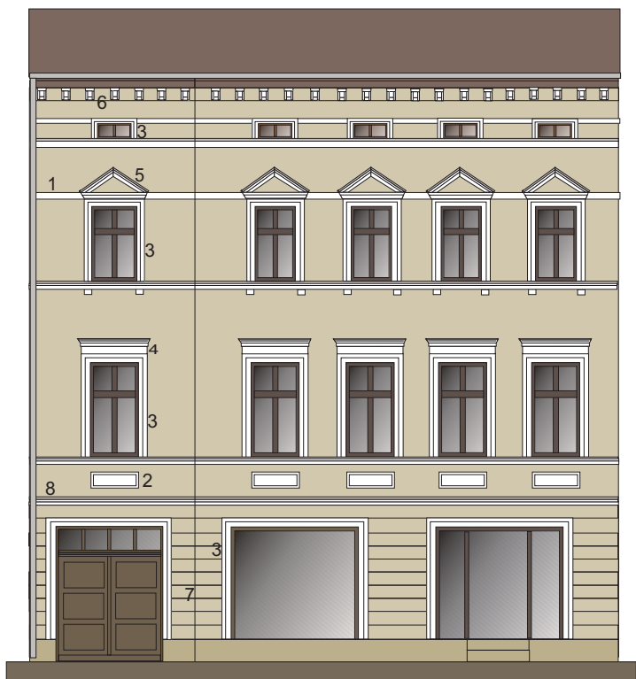
ŚCIANA FRONTOWA PÓŁNOCNY-WSCHÓD