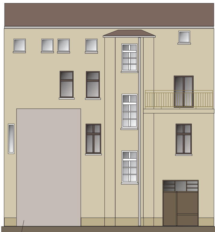
ŚCIANA PODWÓRZA POŁUDNIOWY-ZACHÓD